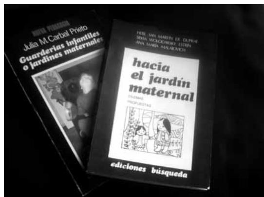
Los primeros desarrollos del Jardín Maternal en la Argentina fueron registrados en estas publicaciones.

Hebe, por supuesto, conocía la obra de Piaget pero no era militantemen-